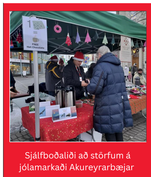
Sjálfboðaliði að störfum á jólamarkaði Akureyrarbæjar

Fyrsti fundur með sjálfboðaliðum í Eyjafirði var haldinn í nóvembermánuði þar sem drög voru lögð að fyrsta samfélagsverkefninu. Það fólst í sölu velferðarstjórnunnar til styrktar Velferðarsjóðs Eyjafjarðarsvæðis á jólamarkaði Akureyrarbæjar sem staðsettur var á Ráðhústorginu. Sjálfboðaliðar voru 16 talsins.