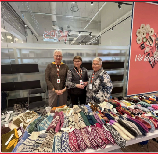
Pop-up markaður á Glerártorgi

Torgsölur eru einskonar „pop-up markaðir“ sem haldnir eru á Ráðhústorgi á sumrin og Glerártorgi á veturna. Þar eru seldar lopavörur sem komið hafa í söfnunargáma eða hafa verið þrjónaðar úr innkomnu garni í þrjónahópnum á Akureyri. Miðað er við að setja upp torgsölu á Ráðhústorgi þegar flestir farþegar skemmtiferðaskipa eru í höfn. Sjálfbóðaliðar í torgsölu voru 4 en fleiri aðstoða við flutninga og uppsetningu á vörum.