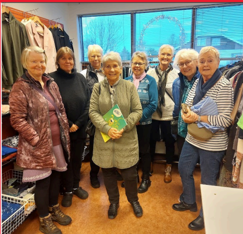
Hópur sjálfboðaliða frá fataversluninni á Akureyri fór í fræðslu- og hópeflisferð

Sjálfboðaliðar í fataverslunum og fatamörkuðum voru 67, þar af 56 á Akureyri, 7 á Dalvík og 4 í Ólafsfirði.