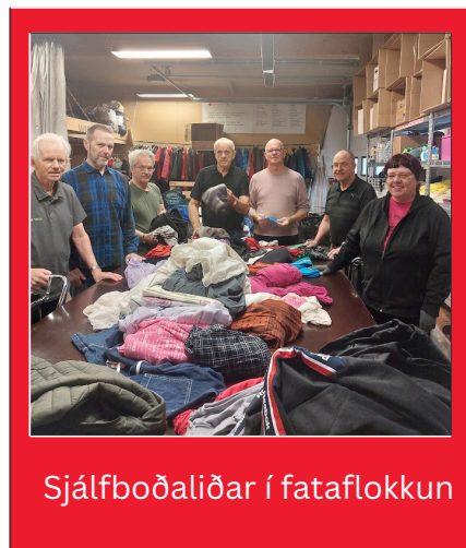
Sjálfbóðaliðar í fataflokkuðun

Samkvæmt nýjum lögum er sveitarfélögum nú skylt að halda úti sérstakri söfnun á textíl. Við lok árs 2024 gerðu Rauði krossinn við Eyjafjörð og Akureyrarbær með sér samkomulag um söfnun, flokkun og sölu á textíl. Um er að ræða fyrsta slíka samkomulagið á landsvísu.