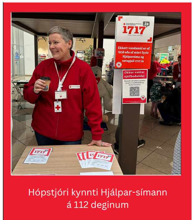
Hópstjóri kynnti Hjálpar-símann á 112 deginum

Á árinu tóku 16 sjálfbóðaliðar þátt í verkefninu.