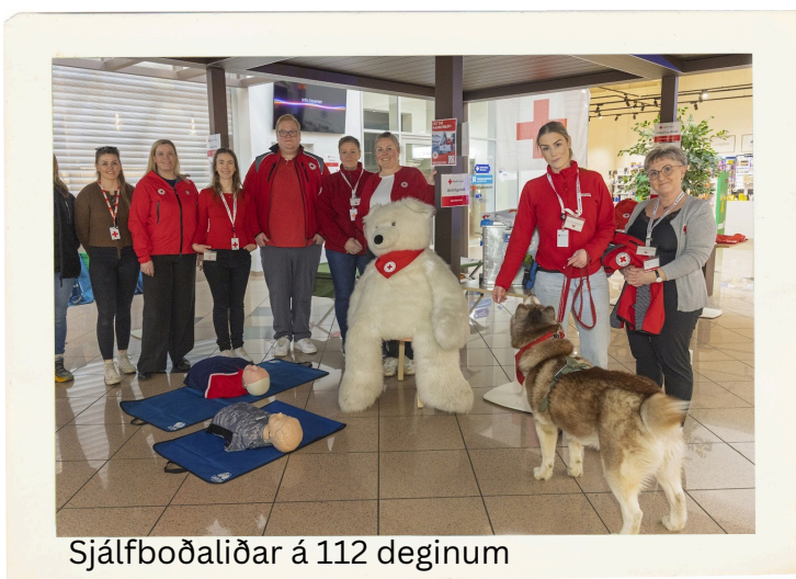
Sjálfboðaliðar á 112 deginum