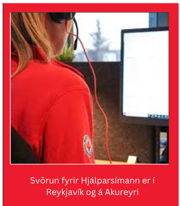
Svörun fyrir Hjálparsímann er í Reykjavík og á Akureyri