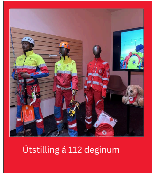
Útstilling á 112 deginum

Árið 2024 voru 97 sjálfboðaliðar skráðir í neyðarvarnir á starfssvæðinu. Þar af var 71 sjálfboðaliði skráður í fjöldahjálp, þar af 37 á Akureyri, 11 á Grenivík, 3 í Grímsey, 8 á Dalvík, 6 á Siglufirði og 6 í Ólafsfirði. Það voru 20 sjálfboðaliðar skráðir í viðbragðshóp, flestir á Akureyri en einn í Ólafsfirði og einn á Grenivík. Því til viðbótar voru 3 í aðgerðastjórn og 3 á bakvaktarsíma Rauða krossins.