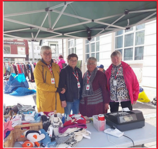
Pop-up markaður á Ráðhústorgi