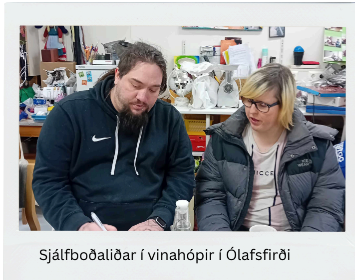
Sjálfboðaliðar í vinahópi í Ólafsfirði